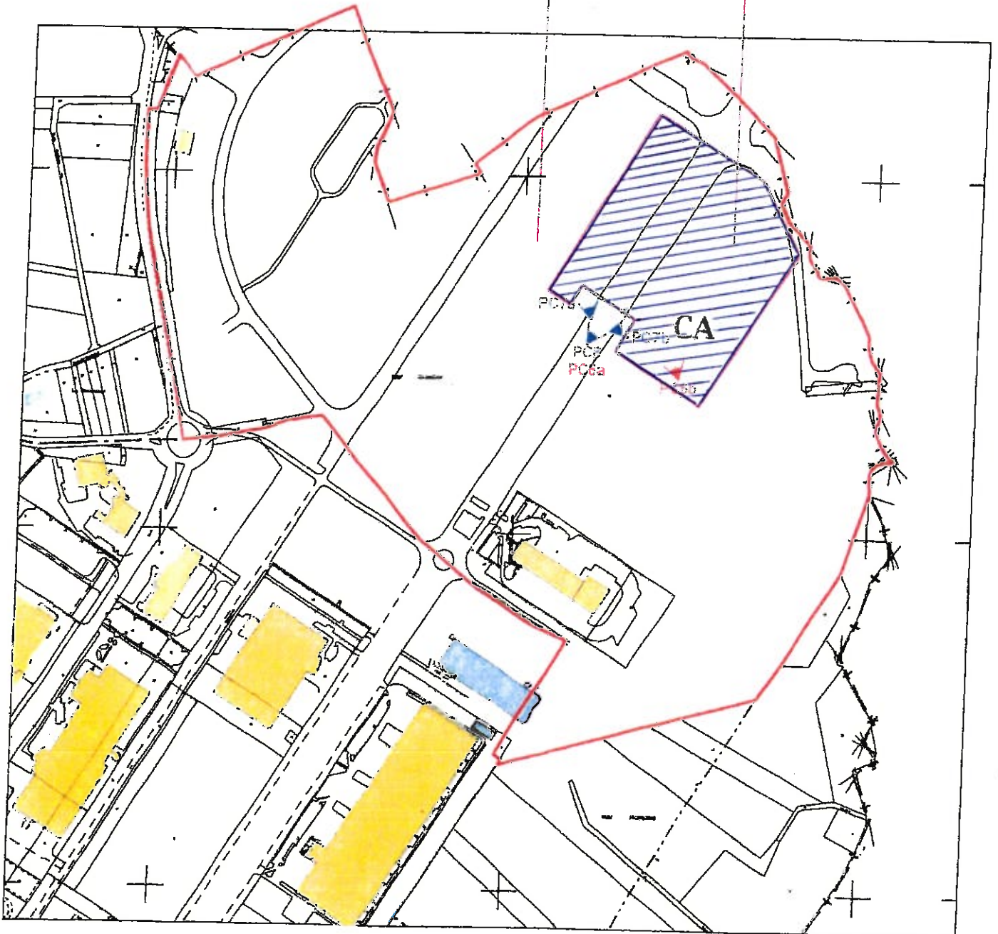
Extrait cadastral du site - 1/10 000°